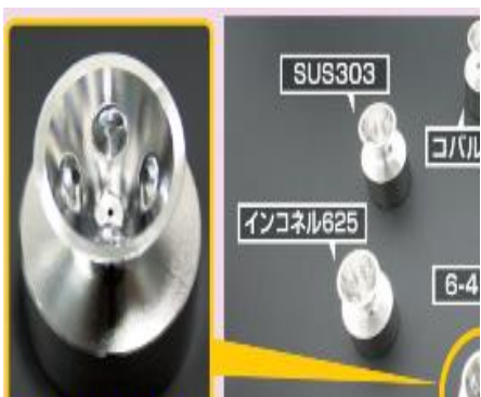
(株)ユー・コーポレーション