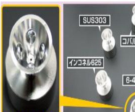
(株)ユー・コーポレーション