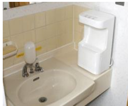
光触媒機能で、除菌消臭 できるハンドドライヤー SAION（サイオン）