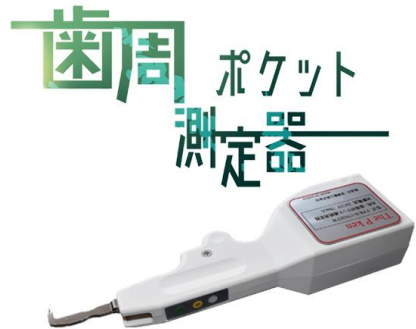
自社開発歯周ポケット 連続測定器 ザ・ピーケン 医療機器クラスII

プリント基板の設計・試作・量産・表面実装・N2 対応（FPC対応）、改造・修理BGA・CSPリワーク・リ ボーリング・エックス線検査、ユニバーサル基板作 成・ケーブル加工・圧縮・圧着、制御盤組立（ユニッ ト組立）、ソフト設計・ハード設計、医療機器の設計、 開発、製造、分析装置組立修理、治工具の設計・製 作、医療機器の製造受託製造、機械設計・デザイン 設計