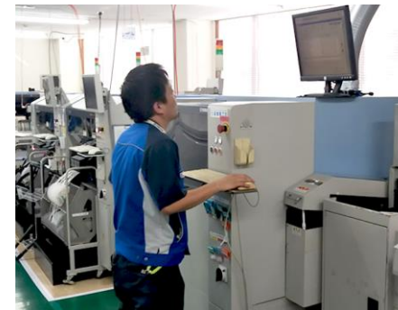
プリント基板の設計～実 装を請け負っております