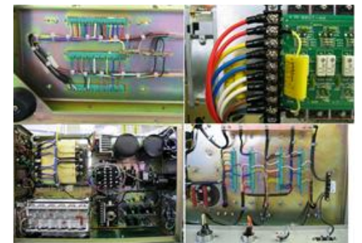
制御ユニットASSY組立 を請け負っております