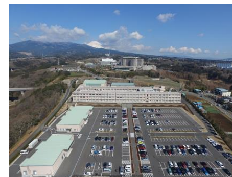
静岡県医療健康産業研究開発 センター（ファルマバレーセ ンター）にて医療機器の研究 開発を行っています