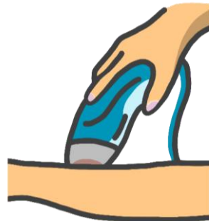
製造受託した製品 イメージ（上図、右図）