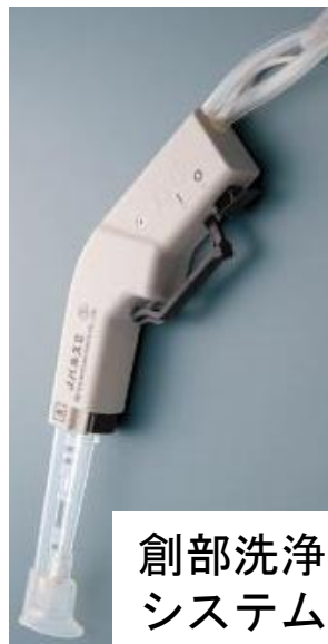
創部洗浄システム