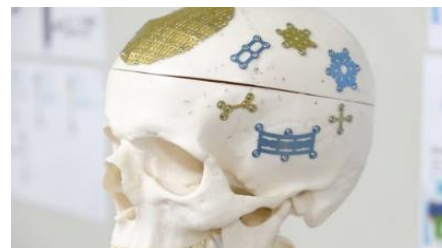
頭蓋骨固定システム