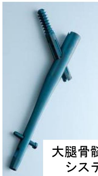
大腿骨髄内釘システム