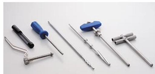
整形外科用手術器械