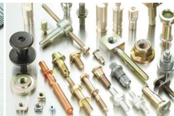
工業用ネジ・冷間鍛造製品